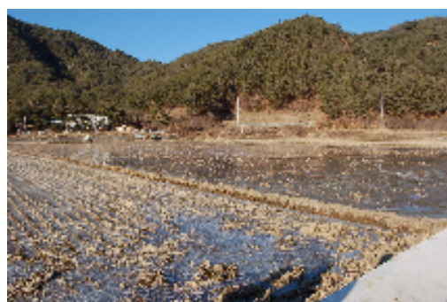
▲蔚珍：田んぼの様子